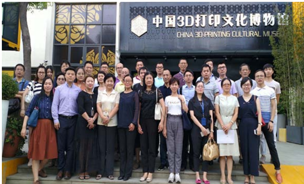
部分会员单位合影

针对机器人行业创新型企业人才招聘后续服务等方面的渴求，联谊会的“专题服务介绍”环节安排了上海对外服务有限公司有关负责人介绍了人力资源服务，受到较好的反响。