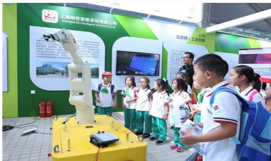
明匠智能系统现场展台

在全国各地设立分会场同步举办的 2017 年全国大众创业万众创新活动周于 9 月 15 日—21 日举行，本届主题为“双创促升级，壮大新动能”，在上海市设立主会场。作为创新驱动发展的重要载体，“双创”带动了新经济发展，新产业、新业态、新模式不断涌现。协会会员单位明匠智能系统、福赛特机器人、提格机器人等作为机器人行业新秀参加此次展会，ABB 作为世界领先企业应邀也参加了此次活动。