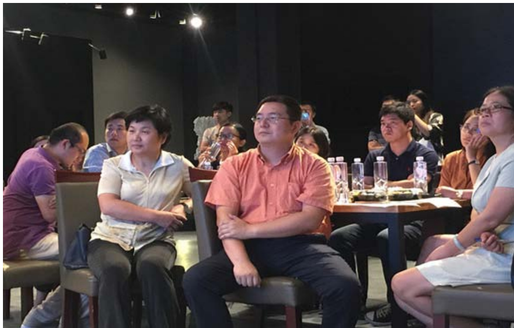
观看智慧园区宣传片

9月1日下午，上海市机器人行业协会会员单位联络员工作交流联谊会在位于宝山的智慧湾科创园区举行。上海电气集团股份有限公司等约五十家协会会员单位代表参与了本次联谊会。